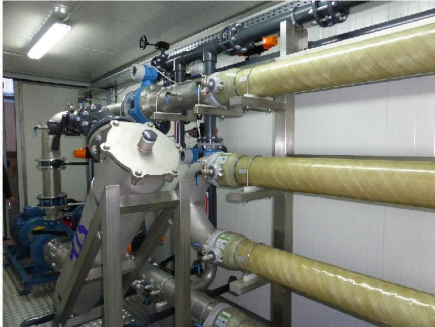
CONTAINERIZED SIDE STREAM MEMBRANES-MBR