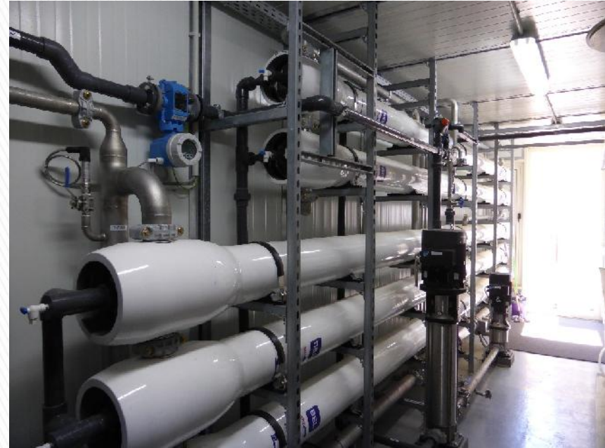
CONTAINERIZED RO MEMBRANES